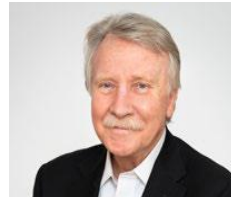
Ilmar Reepalu (S) * Region Skåne