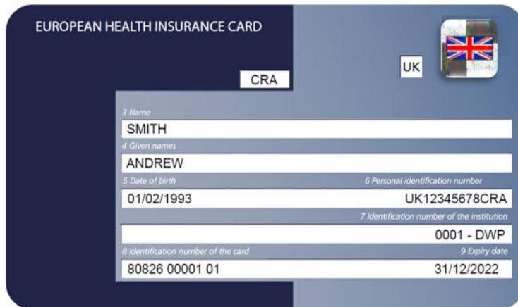
Bild på UK EHIC-kort som enbart gäller i det land som innehavaren vistas i vid årsskiftet 2020//21:

Bild på det nya sjukförsäkringskort (UK EHIC) som gäller i alla EU/EES-länder och Schweiz (kortet gäller även i bosättningslandet men en person med ett brittiskt S1-formulär för bosättning i Sverige har rätt till vård här på mer förmånliga villkor genom sin folkbokföring):