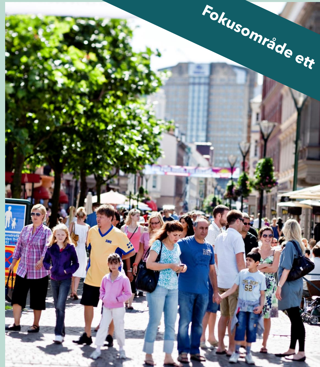
Länen får stöd för att ta fram handlingsplaner, samverka med patienter och brukare och för att införa vård- och insatsprogram och vårdförlopp.